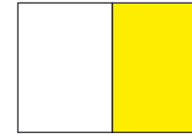
1/1 Seite: 210 x 297 mm