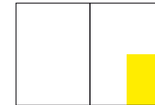
1/4 Seite: 105 x 148 mm