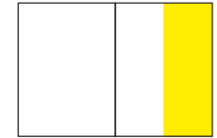
1/2 Seite: 100 x 297 mm