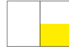
1/2 Seite: 210 x 142 mm