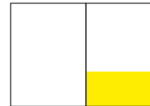
1/3 Seite: 210 x 100 mm